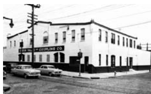
Склад на пересечении Второй и Колумбия улиц в Филадельфии