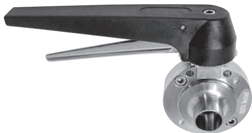
Поворотная заслонка приварная / или с соединениями для сварки

Поворотные заслонки из нержавеющей стали 316 с уплотнениями EPDM под сварку или с соединениями для сварки.