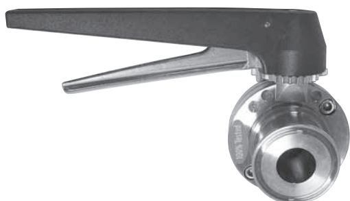
Поворотные заслонки соединением стык / стыковое соединение

Поворотные заслонки с тремя заглушками с уплотнением EPDM и соединением стык / стыковое соединение